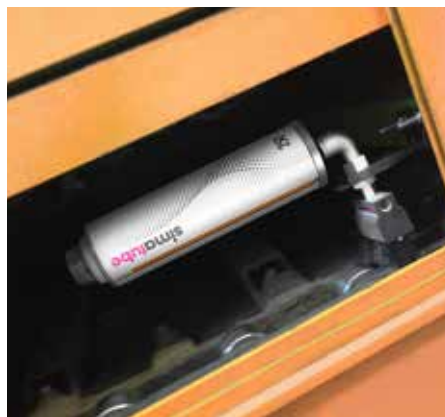
De ketting van een transportband in een recyclingfabriek wordt automatisch gesmeerd en gereinigd door simalube en een borstel.