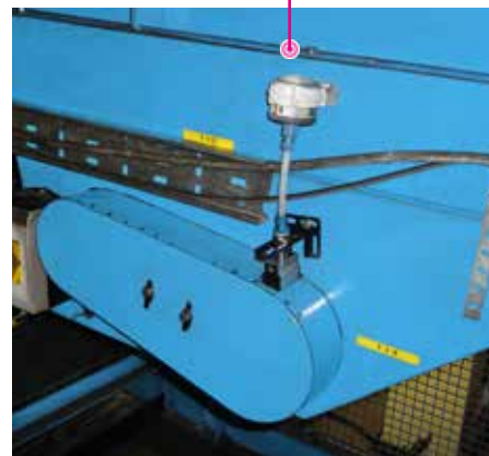
De bagageband in een luchthaven wordt automatisch gesmeerd van buitenaf.