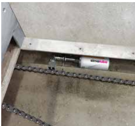
Als er beperkte ruimte is kunnen de simalube patronen ook schuin geïnstalleerd worden.