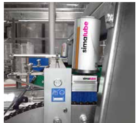
simalube en borstel smeren een ketting in een brouwerij.