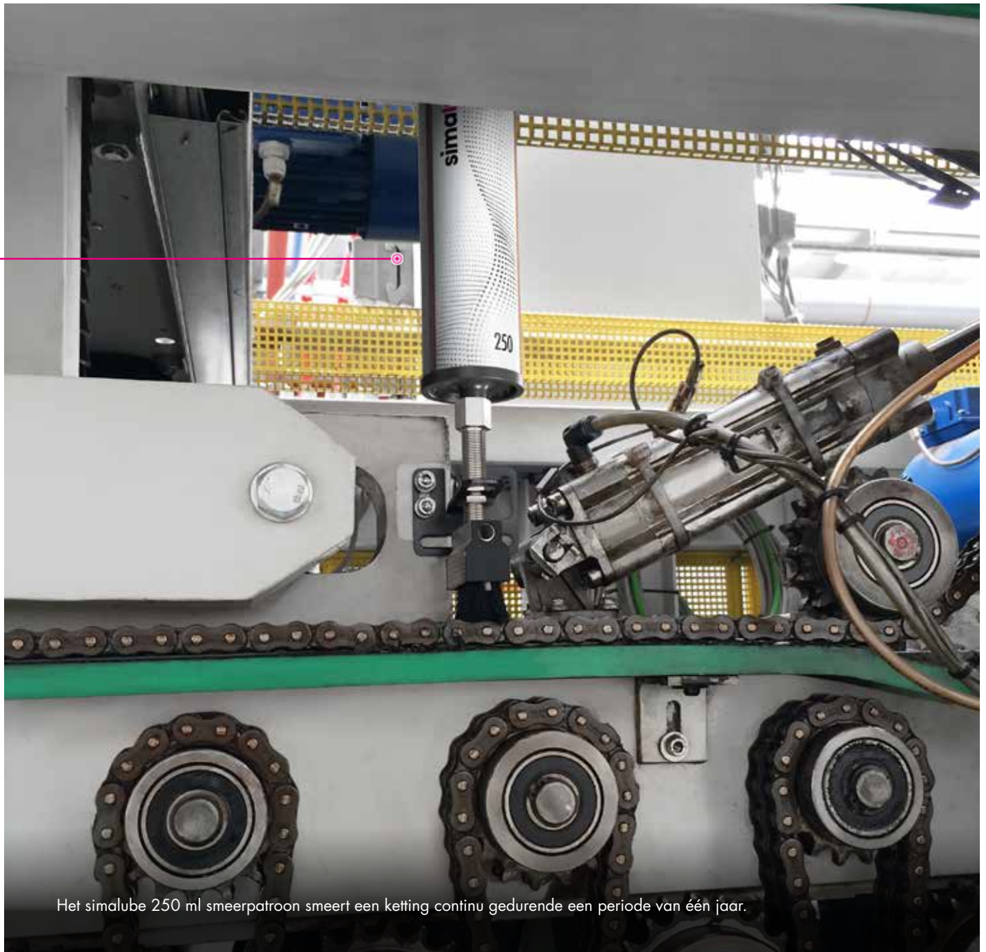
Het simalube 250 ml smeerpatroon smeert een ketting continu gedurende een periode van één jaar.