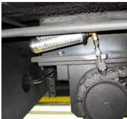
Het simalube 250 ml patroon smeert de kettingaandrijving van een spoorkraan. Het patroon is beveiligd door een beschermingskas.

«Bespaar tijd en verbeter betrouwbaarheid met simalube kettingolie»