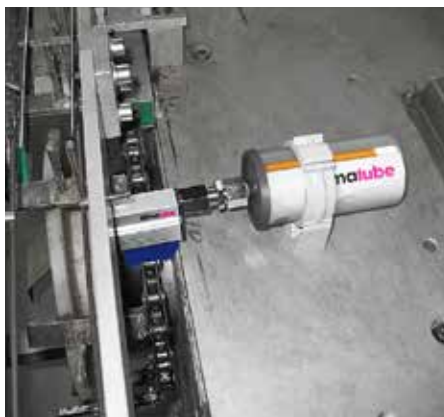
In de voedingsindustrie wordt een speciale blauwe borstel gebruikt met voedingsolie.