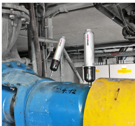
Les paliers de la pompe sont lubrifiés avec deux IMPULSE et simalube 250 ml.