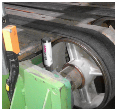
Dans les usines de carton ondulé, les paliers des bandes transporteuses sont continuellement lubrifiés avec le graisseur simalube.