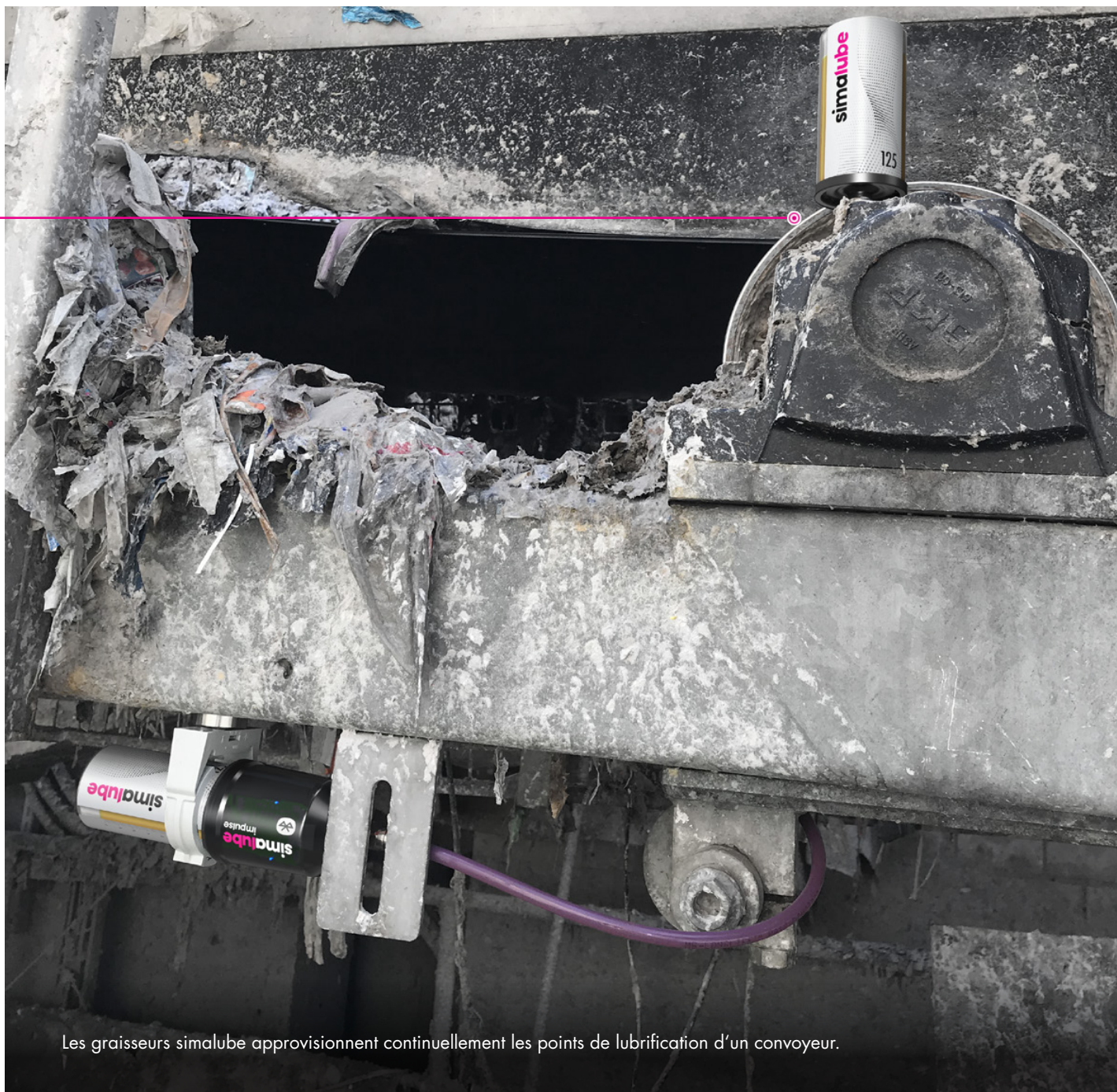
Les graisseurs simalube approvisionnent continuellement les points de lubrification d'un convoyeur.