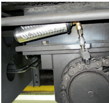
Le graisseur simalube de 250 ml lubrifie la chaîne de transmission d'un portique. Un capot de protection protège le graisseur.