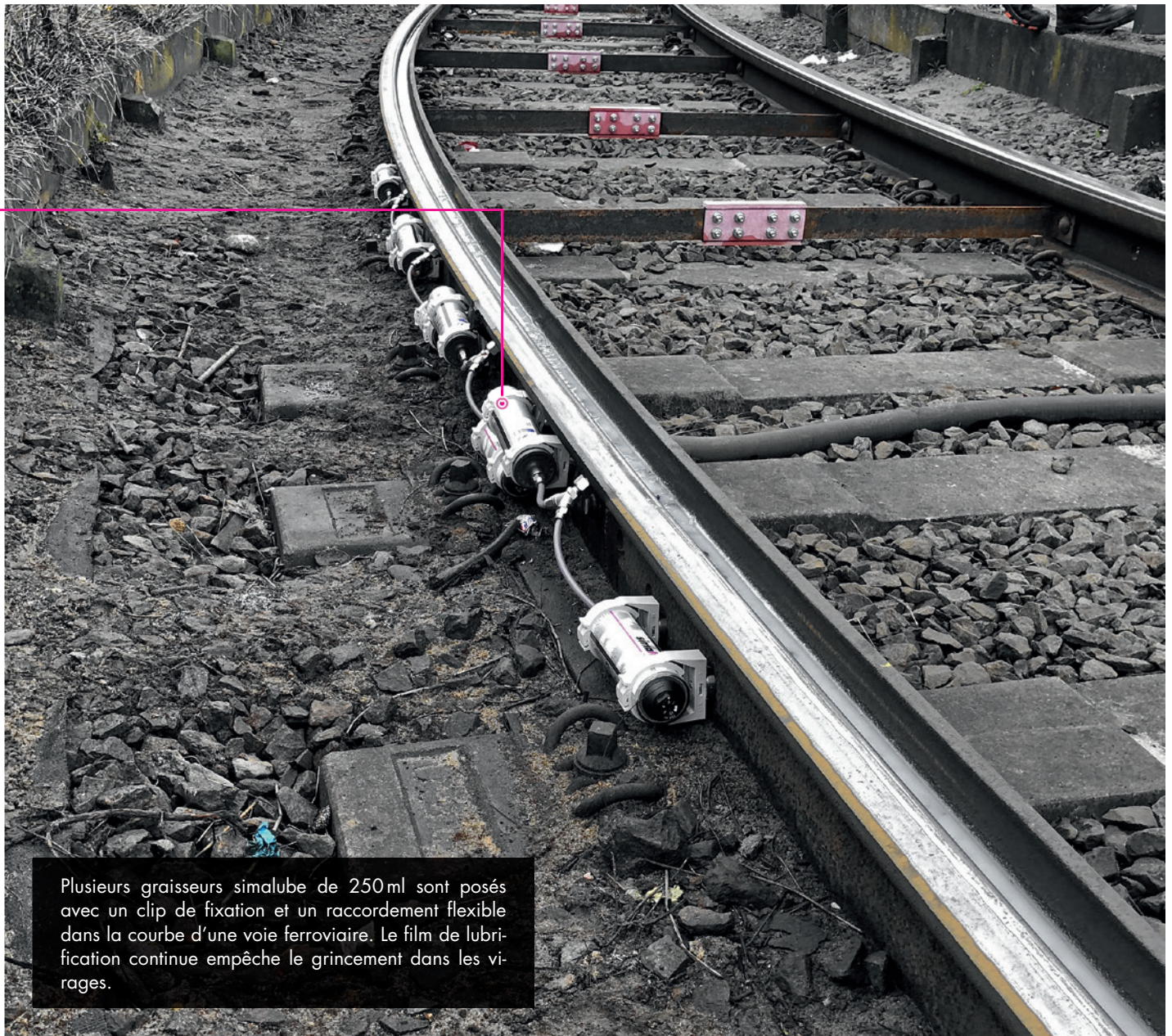
Plusieurs graisseurs simalube de 250ml sont posés avec un clip de fixation et un raccordement flexible dans la courbe d'une voie ferroviaire. Le film de lubrification continue empêche le grincement dans les virages.