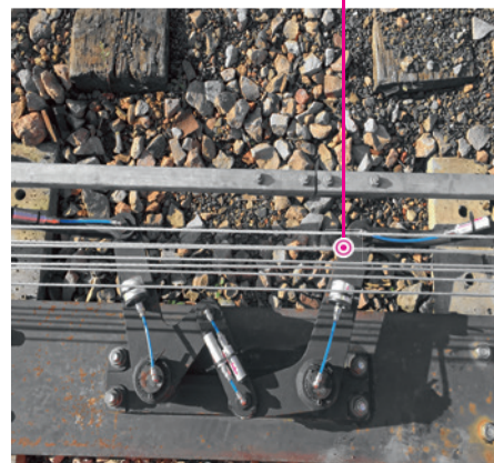
Deux graisseurs simalube de 30 ml et quatre graisseurs simalube 15 ml graissent en continu le compensateur du système de signalisation.