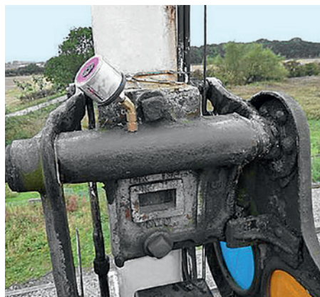
Le palier lisse d'une signalisation ferroviaire est graissé automatiquement et en continu par le graisseur simalube de 30 ml.