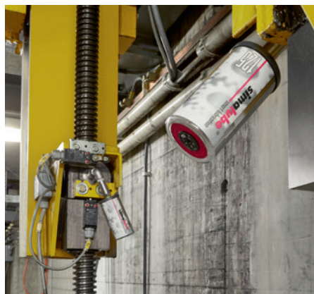
Les broches d'une station de levage pour des wagons et des locomotives ferroviaires sont lubrifiées avec simalube 125 ml sur 12 mois.