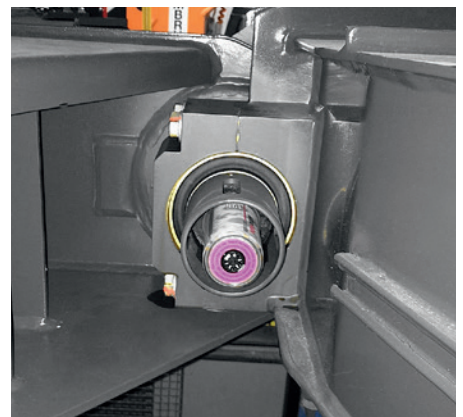
L'attelage de deux wagons est graissé avec un graisseur simalube de 125 ml.