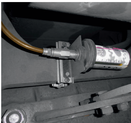
Le graisseur de 125 ml se trouve sur le châssis d'un tramway à plancher surbaissé. La graisse est acheminée par un tuyau vers le point de graissage.